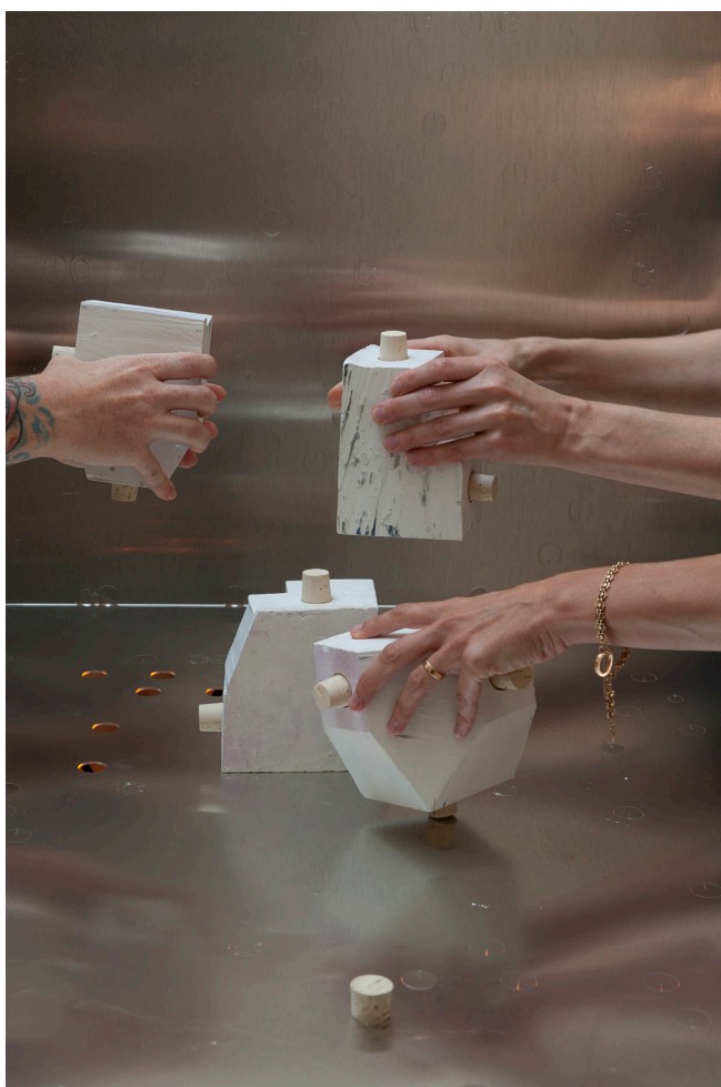
Christoph Meier, sans titre , 2016

Le Casino a récemment réorganisé ses espaces d'exposition en s'éloignant des white cubes pour adopter une architecture plus ouverte. Le travail de l'artiste autrichien Christoph Meier, qui met l'accent sur l'effacement des frontières et le changement des paradigmes d'exposition sans jamais cesser d'explorer les potentialités de l'espace d'exposition, se prête dès lors parfaitement pour mettre en pratique cet objectif. À travers son travail artistique in situ , Christoph Meier interroge la nature même des œuvres et, plus largement, leur relation avec l'espace, l'architecture et le public. Plutôt qu'occuper un lieu d'exposition avec ses œuvres d'art, l'artiste crée un nouvel espace interactif entre les visiteurs et les œuvres, voire entre les visiteurs eux-mêmes.